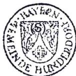
Max Höcherl Erster Bürgermeister

Ortsüblich bekannt gemacht durch Anschlag an der Amtstafel. Angeheftet am 25.10.2024 Abgenommen am 25.11.2024