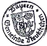
Matthias Wallner Erster Bürgermeister