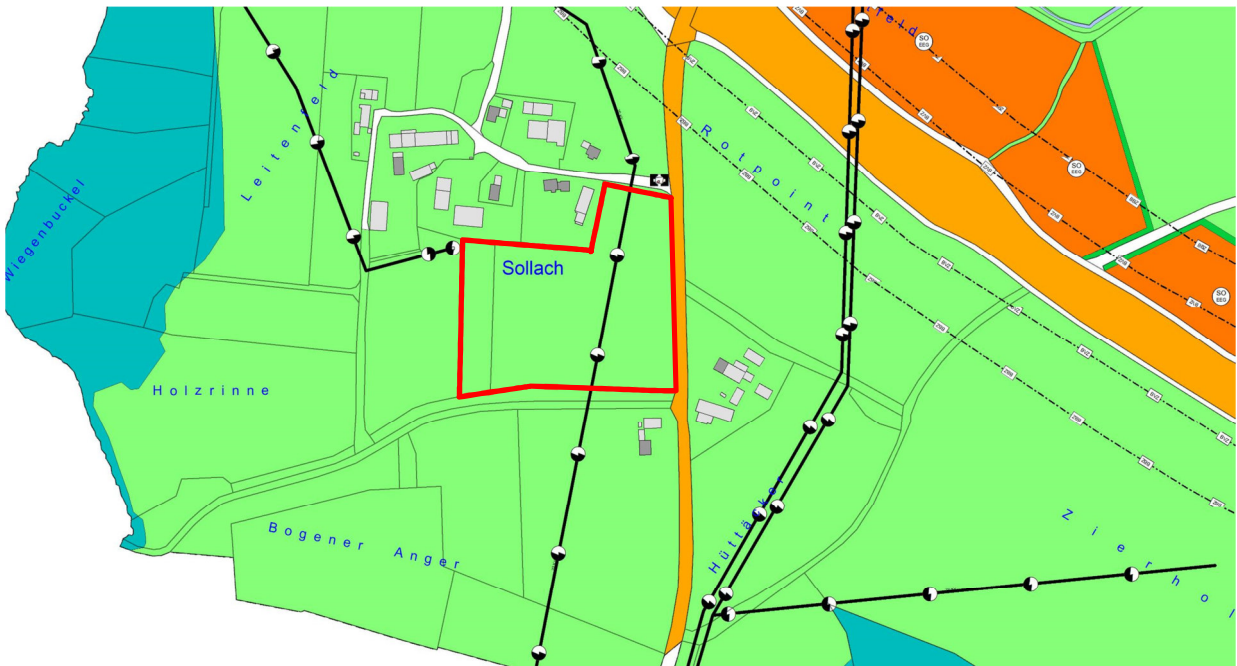
Abbildung 8: Ausschnitt aus dem derzeit rechtswirksamen Flächennutzungs- mit Landschaftsplan – ohne Maßstab