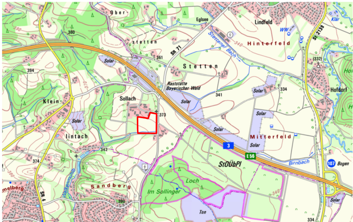
Abbildung 1: Übersichtslageplan aus dem BayernAtlas vom 14.01.2024 – ohne Maßstab