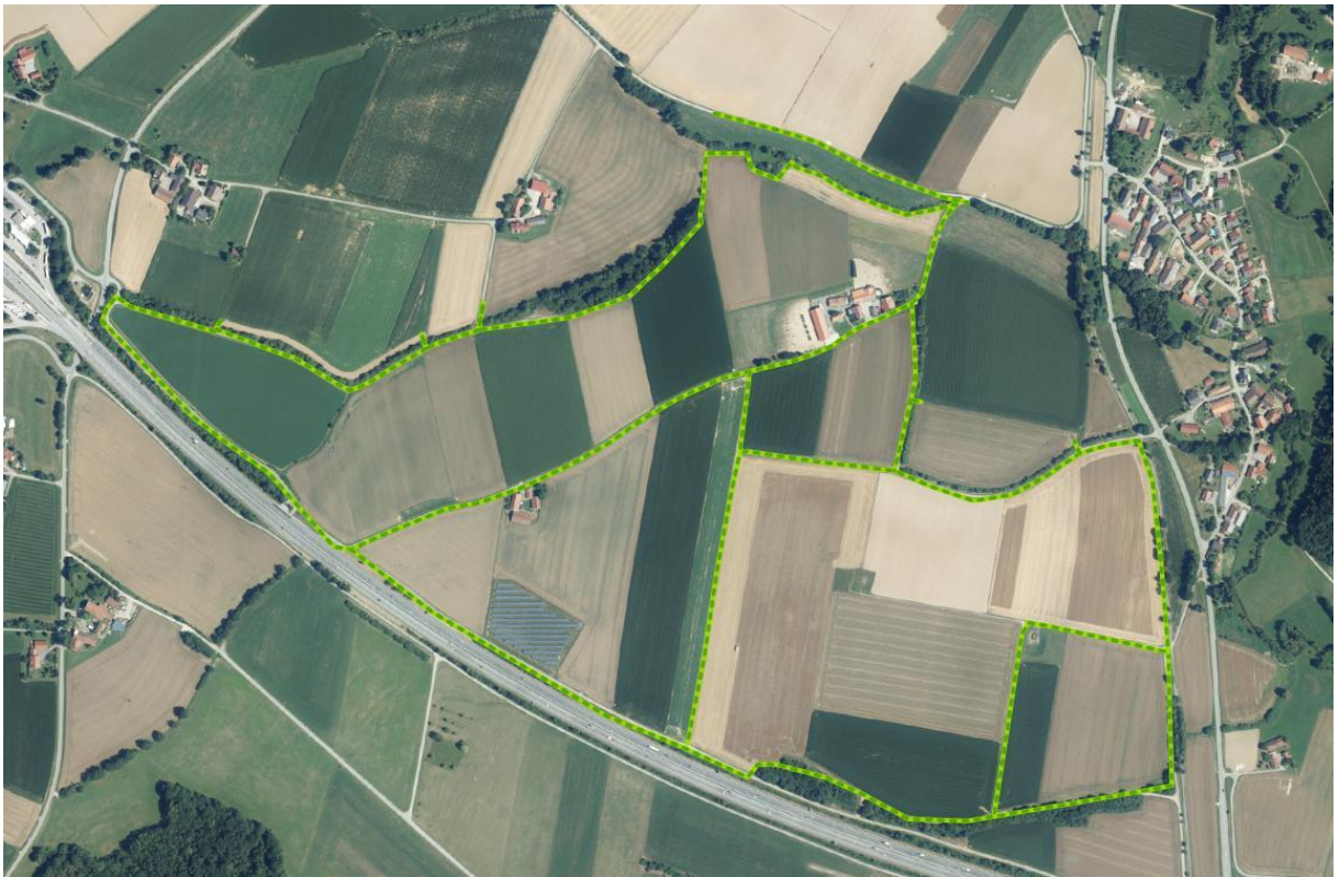
Abbildung 2: Gelb-grüne Linien: Transekte der Vogelkartierung