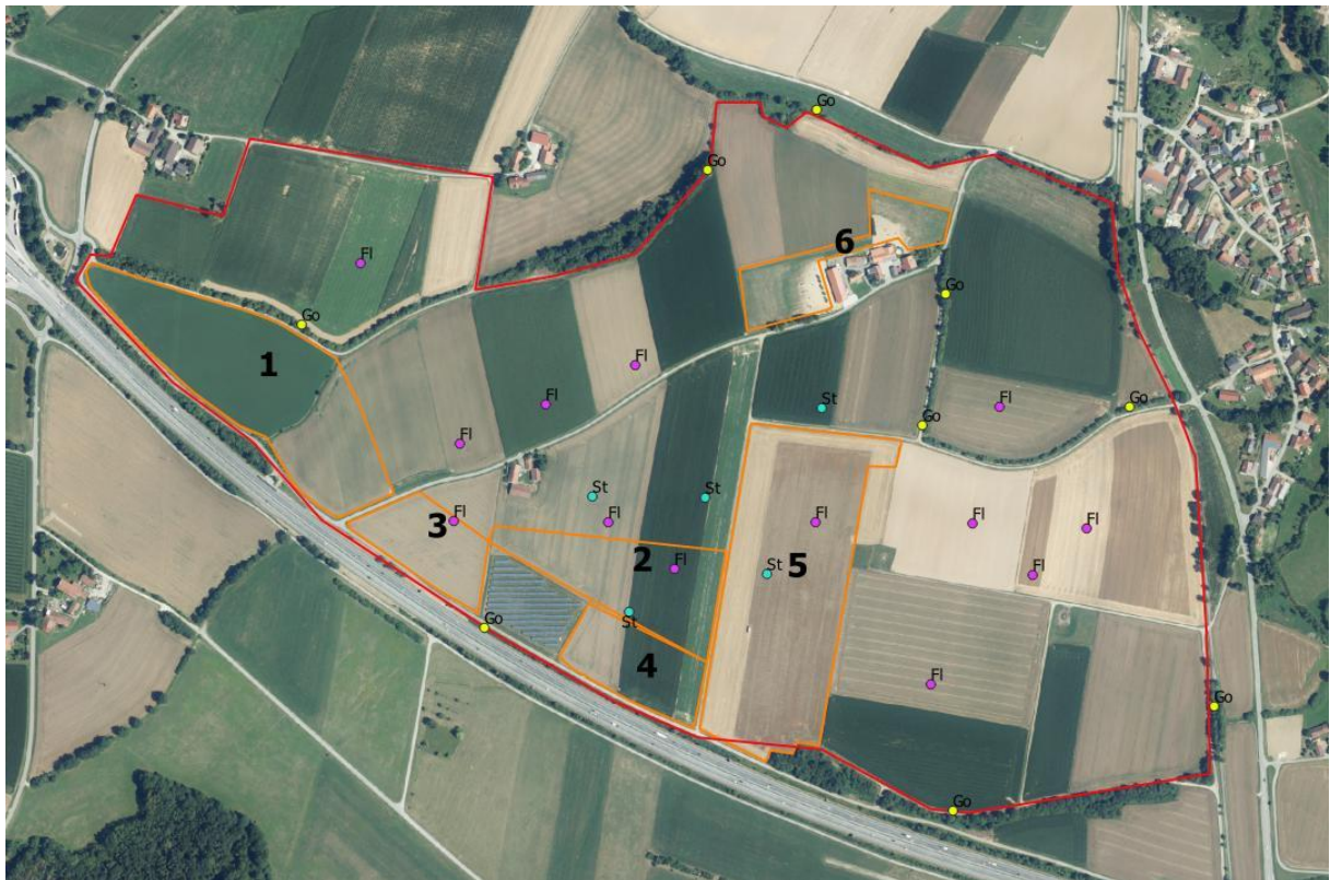
Abbildung 3: Brutreviere der Feldvogelarten: Lila Punkte: Feldlerche, blaue Punkte: Schafstelzen, Gelbe Punkte: Goldammern. Geplante Solaranlagen 1 - 6